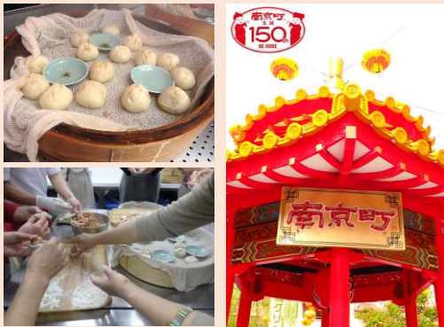
左上・下/ 豚饅頭づくりイメージ 右/あずまや

神戸を代表する観光地、「南京町」。創業102年、地元で愛され続けている[老祥記]で豚饅頭作り体験と餡と皮の美味しさの秘密に迫ります。普段は食べることの出来ない[老祥記]の絶品まかない飯もご用意。その後は[天福茗茶]にて、器の中でお花が開く工夫茶で優雅なティータイムを。[老祥記]豚饅頭、お土産付。