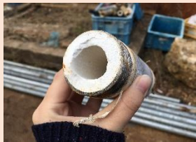
左/炭酸カルシウム付きパイプ

年間180万人が訪れる関西の奥座敷「有馬温泉」。日本三古泉・三名泉としても知られ、1400年も昔から愛され続ける温泉地です。あの『人気まち歩き番組』でも紹介された神戸が誇る名湯を番組さながらご案内いたします。自噴する泉源「天神泉源」にてお湯に含まれる鉄分・塩分・炭酸を体感して頂いた後は、「有馬千軒」と評され賑わいを誇っていた江戸時代に歌や踊りで湯治客をもてなした「湯女（ゆな）」の伝統を継ぐおもてなしの達人、有馬の芸妓衆のお店「芸妓カフェ一条」で休憩を。撮影に携わったお二人から番組の撮影裏話も聞くことが出来るかも！？