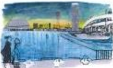
イメージイラストは「月刊長良」の表紙でおなじみの家原誠樹さんが手がける。

■お申し込み・キャンセルのお問い合わせ先: 「おとな旅・神戸」運営事務局 神戸市中央区江戸町85-1 ベイ・ウィング神戸ビル10F 株式会社プロアクティブ内 受付時間:9時半～18時 (土・日・祝日・12/29～1/4・2/27を除く) TEL:078-598-7110 E-mail:info@kobe-otona.jp ※掲載のプログラムは、この広告でのお申し込みを受け付けておりません。詳細は「おとな旅・神戸」公式サイトをご覧ください。