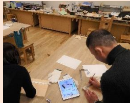
ワークショップのイメージ