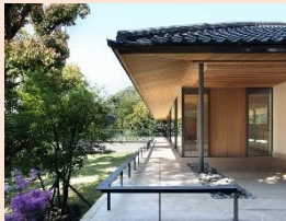
【竹中大工道具館】外観

日本で唯一の大工道具を展示している【竹中大工道具館】。昔の匠の技と心を伝える様々な展覧会や講演会、セミナー、体験教室などを行っており、「ミシュラン・グリーンガイド・ジャポン」でも、二つ星(★★Recommended)を獲得しています。そんな【竹中大工道具館】を丸ごと1日、体感してみませんか。午前中は解説ボランティアのご案内のもと、館内の様々な大工道具や木造建築をより深く学び、午後からはみなさんそれぞれのオリジナルの形でカッティングボードを作るワークショップをお楽しみください。【竹中大工道具館】で木を知り、木に触れる特別な一日を。