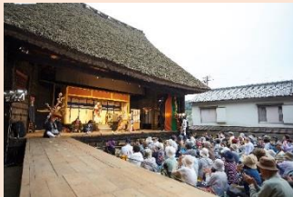
農村歌舞伎上演会の様子