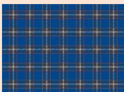
神戸タータン(イメージ)

革・タッセル、それぞれ12色の牛革から選び、ご自身のお好きな色と「神戸タータン」を組み合わせたオリジナル革小物を化粧箱に入れて、お持ち帰りいただきます。