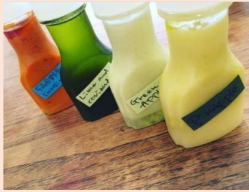
カラフルなソース(イメージ)