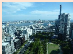
神戸市役所展望ロビーからの眺望