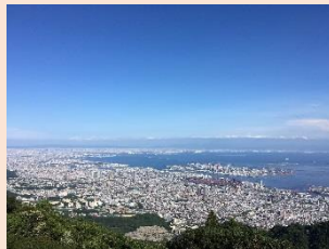
カフェからの展望