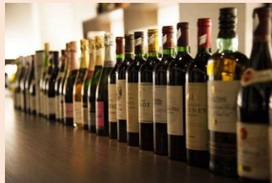
数多くのワインが並ぶ