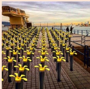
作品イメージ ひまわり/Thank-You Presents to Oxygen 西村正徳