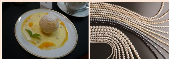
左上／パールスイーツ 右上／真珠 左下／当日の様子

旧居留地にあるレトロな雰囲気の中、真珠博物館「神戸パールミュージアム」で真珠の魅力を再発見！神戸が「真珠の街」と呼ばれるようになった歴史を学び、美しい珠の見分け方やお手入れの仕方を教わります。パールスイーツをいただいた後、あなたが選んだ真珠を使って、イヤリング・ピアスかペンダント（2万円相当）をプロがお作りします。