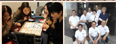
右下／パールシティー神戸 協議会のみなさん